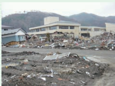
海岸から2キロ以上離れた所でも大きな被害が…

バスパックとは・・・ 災害救援活動を行うため、ひとつの団体として被災地に向かうもので、今回、宿泊代、食事代は参加者負担、交通費、保険代を岡谷市、岡谷市社会福祉協議会で負担しました。