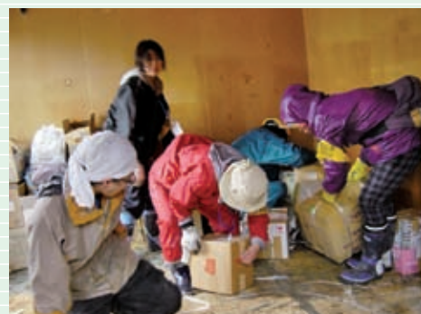
家の方だけでは、大変な作業です。ボランティアさんの大きな力が発揮されます。