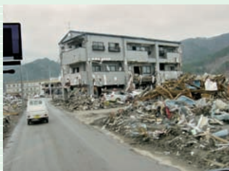
海岸付近は、道路の瓦礫を撤去し車が通るところだけ確保されていました。