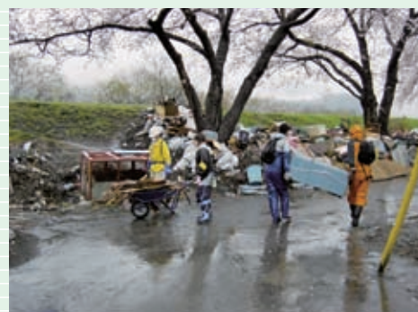
満開の桜の下、道路は、運び出された瓦礫の山。