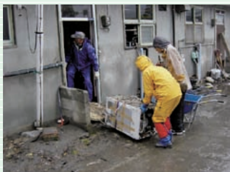
家の中で泥をかぶった家電、家具などを運び出しました。