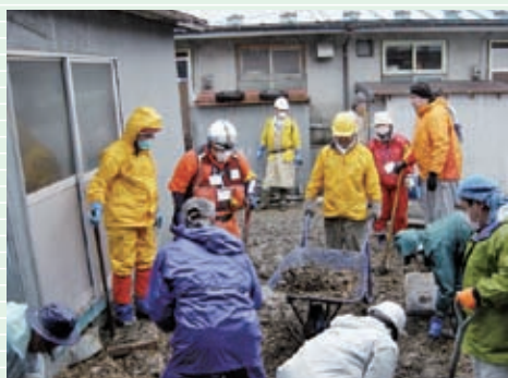
雨の中、黙々と泥だしを行ないました。