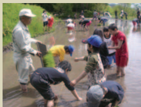
昨年から始まった稲作(田植えのようす)。つつじヶ丘学園の子どもたちと