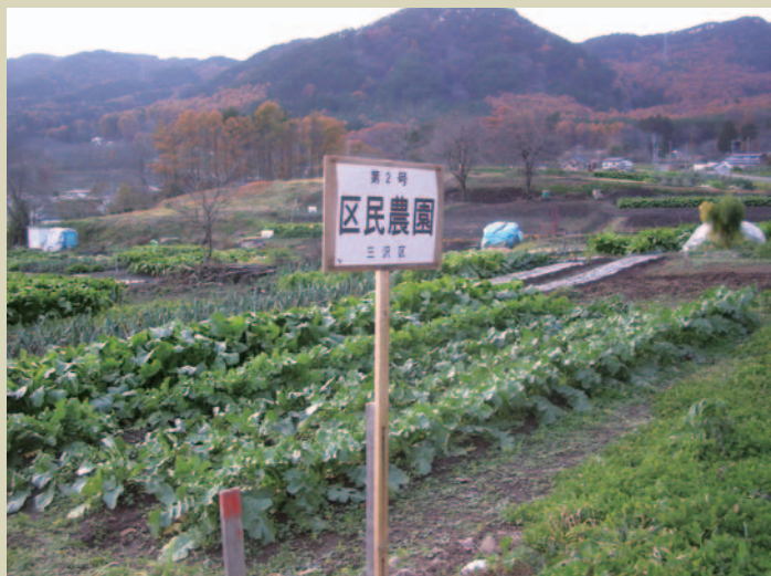
荒廃農地が減り、豊かな農村風景を取り戻した山ざわの畑

子どもたちに農のプロセスを引き継ぐこと は、ふるさとの魅力を伝えること。湧き水や 棚田など当たり前の景色や自然、昔ながら のくらしに価値を見いだす区民参加の 活動が、今年もさまざまなかたちで繰 り上げられます。