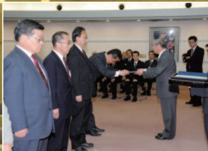
岡谷市議会議員一般選挙当選証書附与式