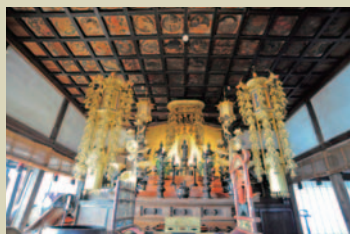
美しい格天井には、建築の重厚感を高める圧倒的な存在感が

江戸時代の私塾「無事庵」の伝統を受け継ぎ、明治時代にはここに「無事学校」が発足。武井武雄が主宰した文化結社「双燈社」も活動の場とし、多くの文化人が羽ばたきました。近年、境内に同名の会館「無事庵」が誕生し、再び住民の心の拠り所となっています。