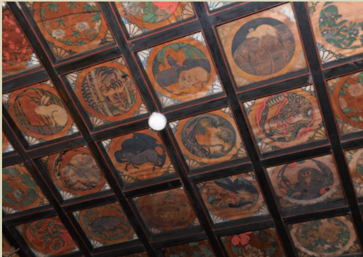
四角の枠と丸い図案のリズムも心地よく、眺めていると時の経つのを忘れてしまう

この天井は、明治時代に廃仏毀釈の混乱のなか、諏訪大社上社神宮寺普賢堂から、破壊を免れ諏訪湖を舟で運ばれてきたもの