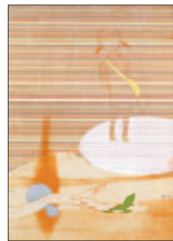
第4回優秀賞「ほたるぎ(おとがながれる)」