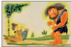
「おりづるのうた」1972年