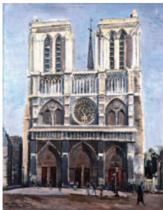
「ノートルダム寺院」高橋貞一郎 作 1938年