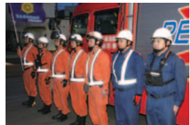
緊急消防援助隊派遣