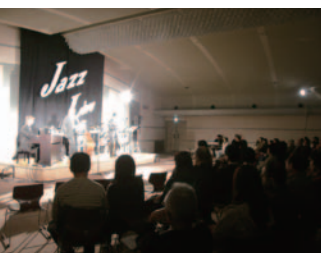
市役所夜景コンサート