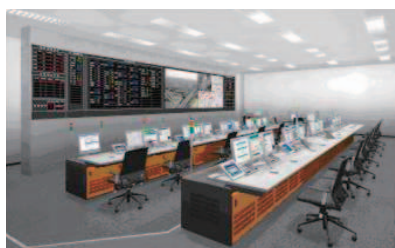
高機能通信司令センター(イメージ)

安全・安心のまちづくりの中心拠点となる新消防庁舎は、岡谷消防署・諏訪広域消防本部・高機能指令センター