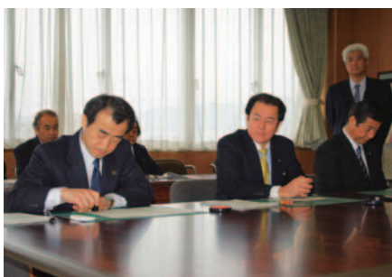
2市1町による調印式の様子

24時間連続運転による安定的な温度管理と処理能力によりダイオキシン類の発生を極力抑えるなど、循環型社会にふさわしい施設となる予定のもと、今後は、環境影響評価(環境アセスメント)を実施し、いっそう環境に配慮し事業展開を図っていきます。