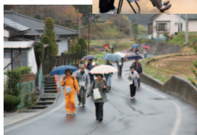
あるき太郎 鎌倉街道壱萬歩 川岸コース

3日 第68回 市民音楽祭 あるき太郎 鎌倉街道壱萬歩 川岸コース 6日 市役所夜景コンサート ミニ市 市長 岡谷市収獲祭 11日 第31回 岡谷ふるさと祭り シルキーバス湊・塩嶺病院線 運行開始 シルキーミニバス実証運行開始 22日 岡谷市民施設見学会 25日