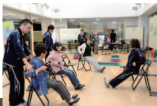
健康づくりのつどい

1日 シルキーバス実証運行開始 2日 ファミリーフェスティバル2011 2日 健康づくりのつどい 議定会 例会 6日 おかやフェスタ2011 8日 秋季塩嶺御野立記念祭 12日 諏訪圏工業メッセ 13日～15日 諏訪湖周一斉清掃 16日 第31回 自衛消防隊操法大会 23日 出早公園もみじ祭り