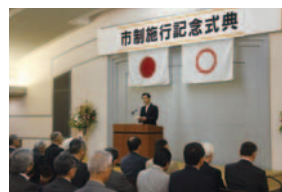
市制施行記念式典