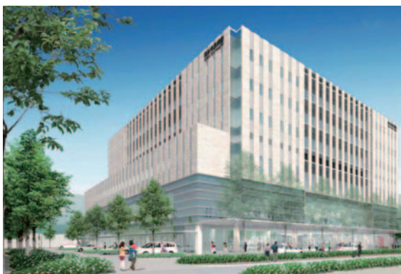
外観イメージ図(業者選定時の資料として作成されたもので、決定した内容ではありません。実際には今後検討し決定していきます)

基本設計業務の中間報告としては、市民病院の各部門によるさまざまな検討を経たうえで、11月から、市議会や近隣地区、また市民のみなさんにその状況などをお知らせしています。みなさんの要望や意見を集