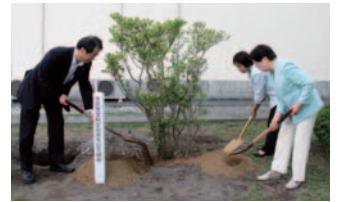
市民憲章制定40周年記念

1日 岡谷市民憲章制定40周年記念 3日 由布姫あじさい祭り 3日 キッズフェスタおかや 10日 第5回 岡谷市民綱引き大会 19日 岡谷市防災の日 制定 24日 第59回 きつね祭 26日 森林の里親 調印式 31日 岡谷一斉気温測定