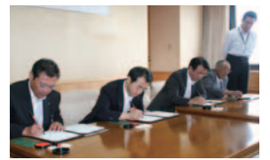
森林の里親 調印式