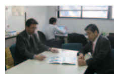
首都圏産業振興活動拠点開所