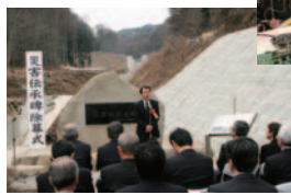
豪雨災害伝承碑除幕式