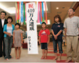
ロマネット 入場者400万人達成