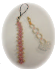
短冊型とハートの2タイプを作ります

カラフルなスワロフスキー・ビーズから、好みの色を選んで、自分だけのオリジナル携帯ストラップを作しましょう。講座で作る作品の見本を公民館窓口に展示中です。