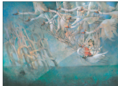
野の白鳥 ドウシヤン・カーライ