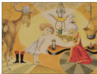
雪の女王 武井武雄

ドゥシヤン・カーライの「アンデルセン童話集」展 会期…9月10日(金)～11月16日(火) 2階 第1企画展示室