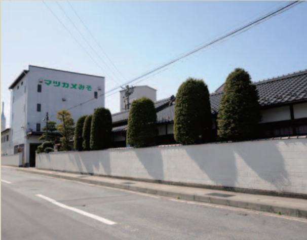
昭和8年、山十製糸の工場の一部を転換して創業。80年の伝統と技術が今に息づく「松亀味噌」の本社