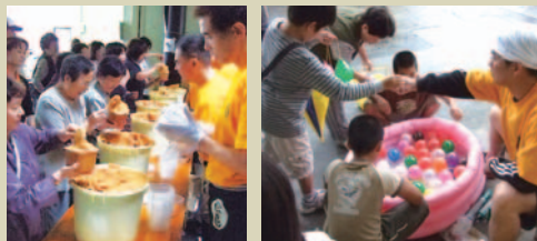
毎月開催される「みそ祭り」。詰め放題やみそ汁サービスが人気で、区民はじめ、たくさんの来場者で賑わう