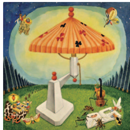
「おりてきたらんぶ」 武井武雄