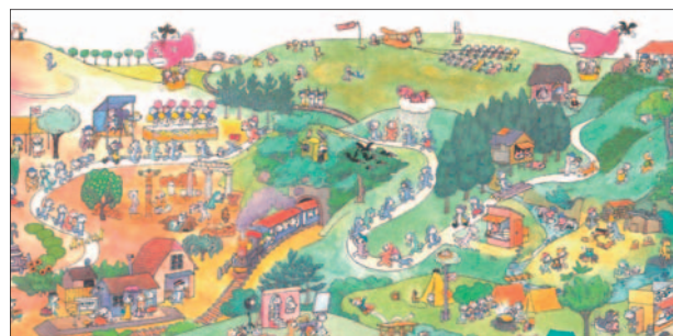
「11ぴきのねこマラソン大会」 馬場のぼる

昭和30年代に発行された「キンダーブック」や「チャイルドブック」などの絵雑誌のなかから「夏」の風景を描いた原画を展示。夏にぴったりの作品が並びます。