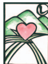
岡谷の自然 しあわせいっぱい

岡谷市は豊かな自然環境に恵まれたまちです。この市民共有の貴重な財産を将来に引き継ぐために、その保全を図ることが求められています。