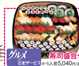
グルメ 寿司盛合せ 宅配サービス 4~5人前5,040円(税込)

お電話で新規ご入会お申込みの際「岡谷広報を見た」とお申し出の方先着10名様に「お寿司」又は「パースデーケーキ」の引換券と諏訪ふれあい広場の利用券・割引券20,000円分をプレゼントします。