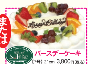
または パースデーケーキ 【7号】21cm 3,800円(税込)