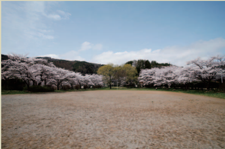
堤が公園となって約四半世紀。子どもたちの歓声が周囲にこだまするのは昔も今も同じ

高度成長期を経て、水田は宅地や工場に姿を変え、農家も減少の一途をたどっていたことから、昭和48年には、堤を埋めて公園化する話が持ち上がりました。区民と市との話し合いは続き、10年後に工事を着工。昭和59年に、流水の広場、池の広場、多目的広場、遊園地広場、芝生広場、ゲートボール場からなる9952㎡(3010坪)の公園が開園しました。翌年には堤公園管理委員会が設立され、区民運