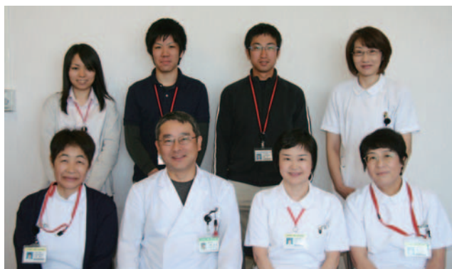
「患者さんやご家族の相談や意見は私たちにお任せください」 医療総合相談を担当する医療ソーシャルワーカーや看護師