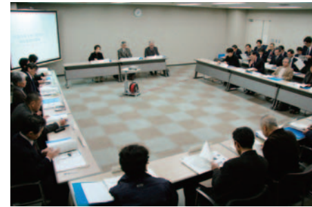
検討委員会の様子

第2回会議では、医療を取り巻く環境や地域医療の現状および平成21年に策定した岡谷市病院改革プラン、岡谷市病院事業の経営状況など、岡谷市民病院の現状や課題などについて理解を深めました。