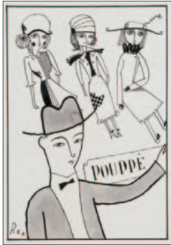
武井武雄 「人形の窓の下の唄」1927年

昨年新収蔵された貴重な戦前作品を、当時の書籍資料と合わせて公開。武井が描く、モノクロームの世界をお楽しみください。