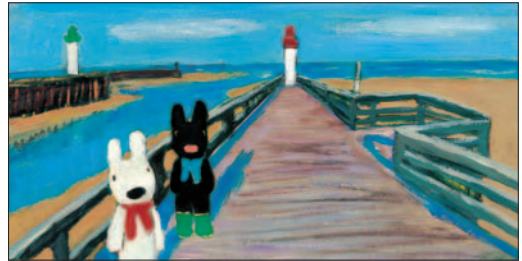
「リサとガスパールのレストラン」 Hachette Livre © 2004 Anne Gutman and Georg Hallensleben

フランス・パリに住んでいる、赤いマフラーをした女の子リサと、青いマフラーをした男の子ガスパールは大の仲良し。好奇心旺盛な2人が繰り広げる物語は、17か国で翻訳され、世界中の子供たちに愛されています。NHK教育テレビでアニメ化されておなじみとなった「ペネロペ」も合わせて、心のなごむ展示をぜひご覧ください。