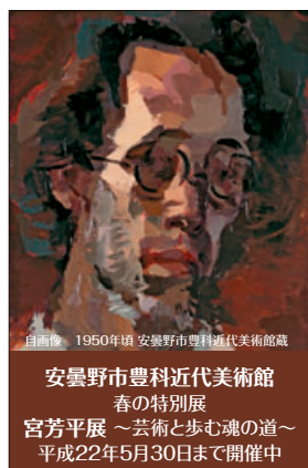
自画像 1950年頃 安曇野市豊科近代美術館蔵

安曇野市豊科近代美術館 春の特別展 宮芳平展 ～芸術と歩む魂の道～ 平成22年5月30日まで開催中