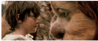
© 2009 Warner Bros. Entertainment Inc.

【休館日】木曜日(2月11日は開館) 【開館時間】午前9時～午後6時 【入館料】一般800円 中高校生400円・小学生200円