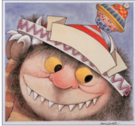
「©Maurice Sendak, F.A.O. シュワーツ玩具店カタログ (1988年). All rights reserved.」 イルフ童画館 蔵