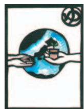
ゆたかな自然を 次世代へ

岡谷市は周囲を山地、丘陵と諏訪湖に囲まれ、豊かな自然環境に恵まれた都市です。その貴重な財産を将来に残すため、環境の保全を図ることが求められています。