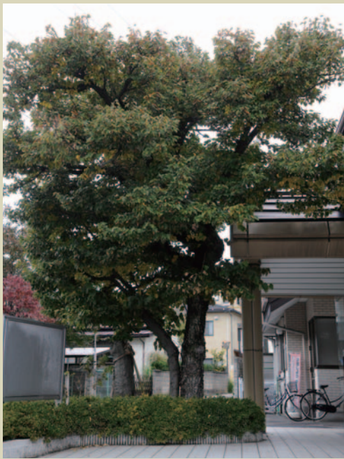
新屋敷に植えられてから、80年あまりが経過し、樹齢は約100年。区唯一無二の記念樹に。これから人により添い、愛されてともに未来へ

用途が広く、古くはその繊維から衣類を、しなやかで耐久性があり加工しやすい性質から、曲げ物などの日用雑器も作られています(シナノキ全般)。淡黄色の花は、6月から7月初旬ごろ開花し、上品な甘い香りを漂わせます。「リンデン」の