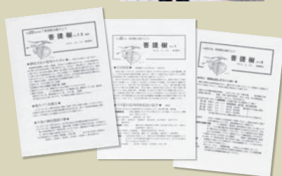
区発行の広報「菩提樹」。タイトルにも利用され、親しまれている