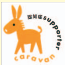
認知症サポーターマーク

現在は、民生児童委員のみならず、各区の保健委員会や生きがいデイのグループ、消防団員のみならずなどが、「認知症サポーター養成講座」や、認知症をテーマにした「地域はつらつ教室」に参加中。