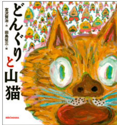
絵本「どんぐりと山猫」表紙 田島征三