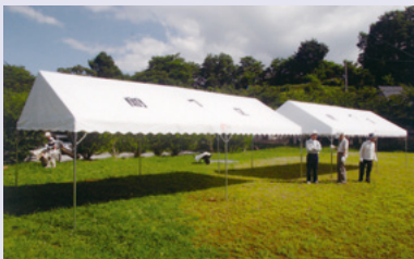
間下区 テント、 放送設備、 物置など

財団法人自治総合センターより宝くじの助成を受けて、間下区で屋外コミュニティ活動資機材、三沢区で視聴覚機器を整備しました。両区では、さらに地域のコミュニティ活動の向上に努めていきます。