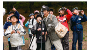
岡谷子どもエコクラブ野鳥観察会

環境基本計画のさらなる推進! 8月の基本目標 自然とふれあえる まちづくり 水や動植物とのふれあいの場の整備を推進するとともに、恵まれた自然環境を適切に保存するよう努めます。 市民のみなさんは… ●自然に親しむ活動に積極的に参加し、緑を保全します。 ●外出中に出たごみは持ち帰り、きち