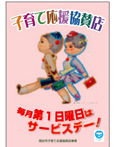
このポスターが目印!