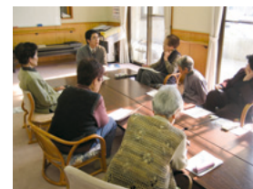
昨年の講座の様子