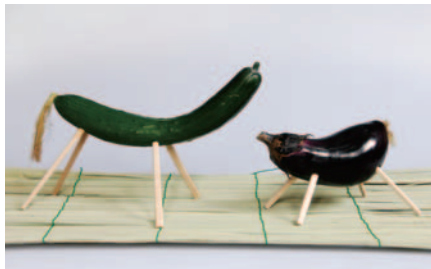
ゆでたそうめんを背中に数本かけ、手綱や荷造りひもに見立てる家もある