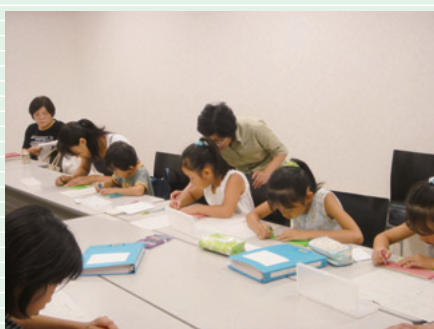
親子点字体験教室