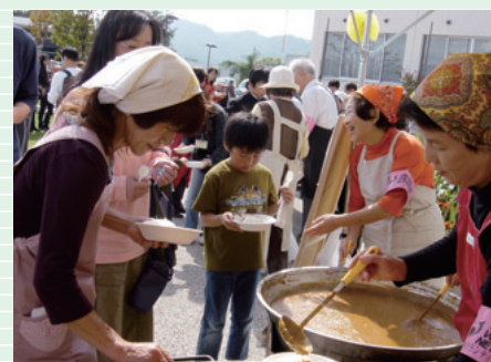
ふれあい祭り&ボランティア祭り