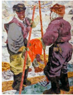
田中隆夫「やつか漁夫」 1959年 油彩

煙突が建つ工場の街、自然の中に広がる田畑などの労働の場、そしてそこで働く人々の姿…絵画の題材として多く描かれてきた、人間のいとなみと風景にスポットをあて「働く人々」をテーマに作品をご紹介します。