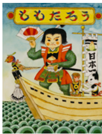
「ももたろう(表紙)」 1976年

「ももたろう」「うらしまたろう」「したきりすずめ」など、なじみ深い昔話の原画を公開。武井流のユーモアを交えながら、美しく軽快に描かれた昔話の世界をぜひご覧ください。