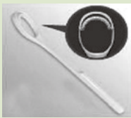
舌専用クリーナーを使うと、驚くほど簡単に舌苔が取り除けます

最近では、口臭の強さを測定する機械もあります。舌苔の掃除をするだけで、口臭測定の数値がその場で半分以下になります。即効性の高い方法なので、気になる人は舌専用クリーナーで掃除してみてください。歯科医院や薬局などで購入できます。歯ブラシで舌苔を取り除こうとすると舌を傷つけ、そこから細菌に感染する可能性もありますので、専用クリーナーを使うことをおすすめします。