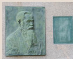
肖像レリーフは、昭和27年、市内商工業者により像のない基壇に掲げられた（清水多嘉示作）