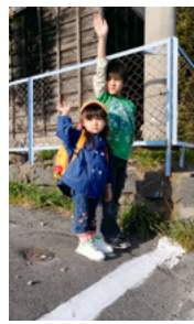
ストップラインで安全確認

毎年入園時期に合わせて行うストップライン作戦は、20年以上も続けられてきました。市内公立保育園14園の母親らで作る岡谷市交通安全母の会が、園児の家庭や各保育園付近の危険か所に小さな足型と白線を引き、園児がここですって止まるように指導、安全確認を習慣化して飛び出し防止につなげている活動です。「園の規模にもよりますが、保護者が協力して作業を行い、継続的に見守りを行ってまいります。今年度は「手をつなぎ親子で守ろう 交通ルール」が目標で、今後は市安全教室への参加や親子安全教室、年長園