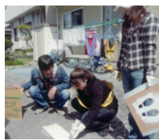
ストップライン作戦準備風景