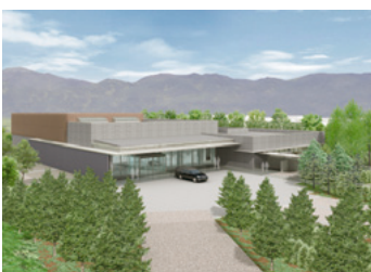
湖北火葬場完成予想図

※応募名称は、未発表のオリジナルのものに限ります。また、採用された場合は、一切の権利は湖北行政事務組合に属します。なお、使用にあたっては手直しをする場合があります。