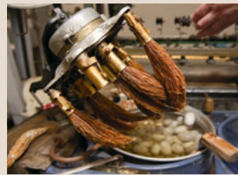
繭から糸口を見つけ出す自動索緒装置