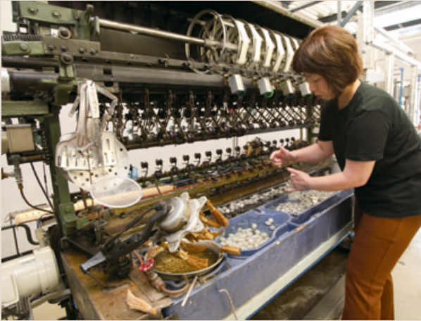
昭和31年に26台の「検定用多条繰糸機」を設置、製糸工場と同様の繰糸方法で正確な検定を実施した(現存は1台=近代化産業遺産)。自動繰糸機検定に移行後は、CT1型(自動繰糸機6緒タイプ)、CT2型(自動繰糸機3緒タイプ)が活躍した

同試験所は、数々の革新技術により、シルクテクノロジー応用へ新たな道を拓き、農業生物資源研究所と名前を変えた今日も、全国で唯一、多条繰糸機から自動繰糸機へと変遷する一連の検定用繰糸機が、実際に研究に使われている貴重な施設でもあります。時代の流れから平成23年の閉所が決まって