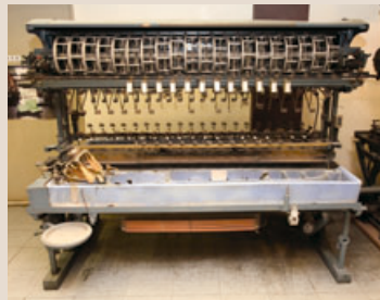
製糸工場以外に全国の繭検定所でも使われた増澤式多条繰糸機。写真は長野県繭検定所岡谷支所で使われていたもの(岡谷蚕糸博物館蔵)

で、新鋭機に場所を譲り少し肩身を狭そうにしながらも、孤軍奮闘している工作機械こそ、優れた製糸機械を生み出してきた「横フライス盤」です。輝かしい歴史と技術者たちの誇りを受け継ぐ古参の気骨を、今なおシルクの新たな可能性に向かって示します。