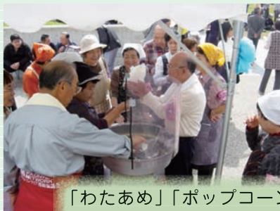
「わたあめ」「ポップコーン」も大人気!