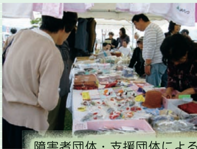
障害者団体・支援団体による作品販売