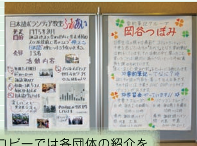
ロビーでは各団体の紹介をパネル展示