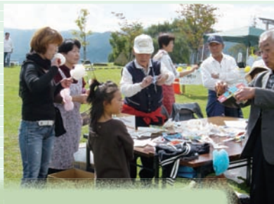
紙飛行機うまくできたかな?