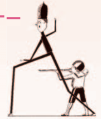
てっぼうだま太郎