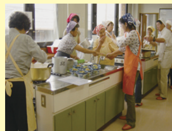
食生活改善推進協議会の方を講師に料理講習会