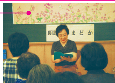
大人のための朗読会

:「朗読の会まどか」は声の広報テープ作成、大人のための朗読会、施設での対面朗読、小・中学校での読み聞かせなどの活動を行っています。