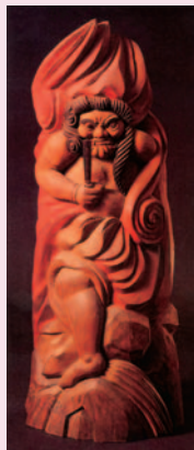
拜滝不動明王坐像 文久3年頃 木喰