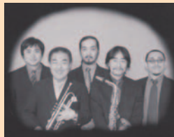
The Bop Band