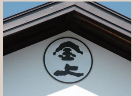
改修を経て「金上」の屋号を掲げる