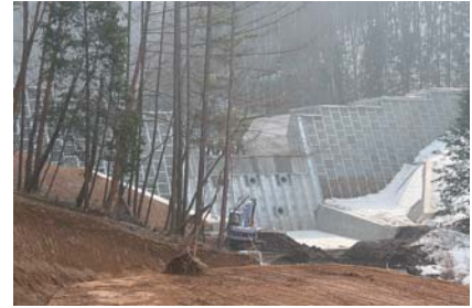
完成した砂防えん堤（橋原区）

上の原小学校上の災害復旧砂防・治山工事がこのほど完成したことを祝い、地元横川区により上の原小学校の児童や地元関係者が参加して、災害防止を祈願した植樹式が行なわれました。また3月末には、平成18年7月豪雨災害により被害のあった12溪流に砂防えん堤工事と、土砂崩落箇所を復旧する治山工事が完成しました。今後は、追加される砂防えん堤の設置工事やえん堤下流の流路工事などが平成21年度まで予定されています。