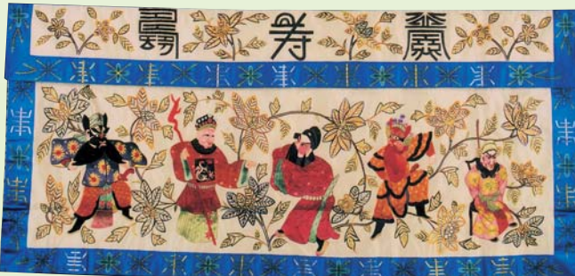
白地繡人物祝寿堂彩 清代 復元品

今回の展示では、3000年という長い年月の中で、高度な技術に裏づけられる復元絹織物を一挙に公開し、あわせて今、私たちに生きる“絹ものがたり”をご紹介します。30点を超える中国古代復元絹織物を一挙公開するのは、日本で初めてのことです。多くの方のご来館をお待ちしています。