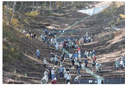
完成した治山工事（花岡区）