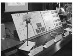
△昨年の発表会の様子