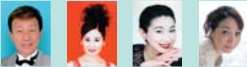
橋 幸夫 黛 ジュン 小川 知子 麻丘めぐみ