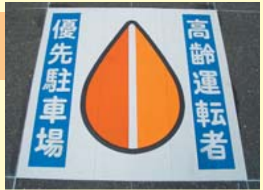
高齢運転者優先駐車場マーク

あなたの傑作、どう残しますか?—超高画質 ハイクオリティデジタル 自費出版「ハイデル」コースの薦め—