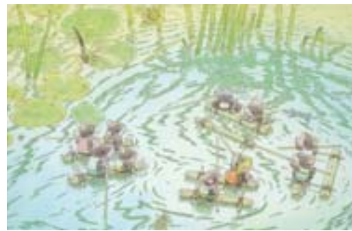
「14ひきのとんぼいけ」

2階第一企画展示室 9月4日（火）まで 代表作の『14ひきのシリーズ』や『かんがえるカエルくん』、『もりのあかちゃん』などの原画を展示します。