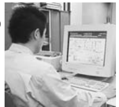
▲水源監視室のようす