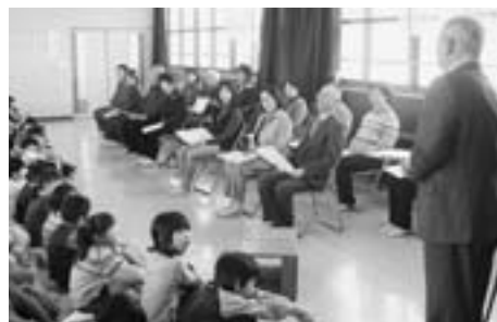
湊小学校ボランティアお礼の会

日々の生活の中で、子どもたちを犯罪や交通事故から守ろうという、ちょっとした気配りの心が“ふれあいたいむ”です。