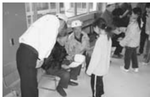
川岸小学校ふれあいパトロールのみなさんとの交流会