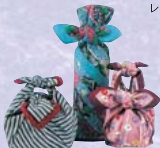
(包み方パンフレット差上げます)