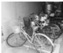
△市では近くに行く時は自転車を利用