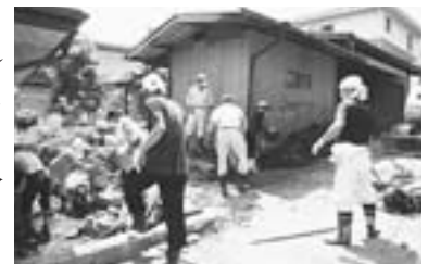
住民等が泥排出作業を協力して行っている様子

平成18年7月豪雨災害時には、岡谷市でも、区、町内会を中心にした自治会組織の重要性や住民どうしが助け合う活動の有効性が実証されました。