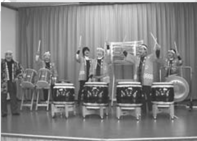
【2月20日に区関係者により入魂式が行われました】

岡谷区では、太鼓を通じた地域コミュニティの活性化、子どもの健全育成に活用していきます。