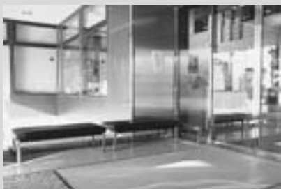
ベンチを置いた風除室