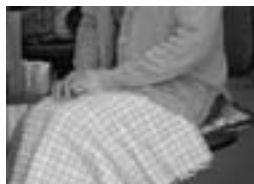
△カーティガン・ひざ掛けでウォームビズ