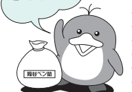
ホク「岡谷ペン助」です