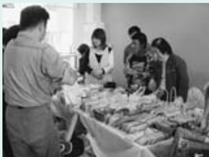
障害者団体による販売

10月14日(土) ふれあい祭りとボランティア祭りを同時開催し、にぎやかなお祭りになりました。 「ブリッジ泉」の実践報告、「岡谷手話サークル」のミニ講習会と手話の歌の発表。「M50会」のマジックショー、「豪雨災害救援ボランティアセンター」の活動報告・写真展示がありました。