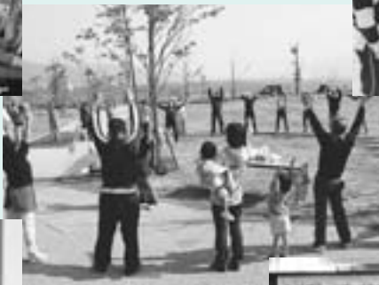
食後のふれあいダンスタイム