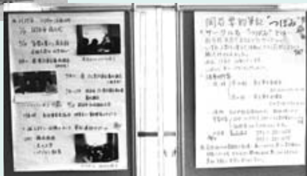
要約筆記グループ「つぼみ」のパネル展示

点字サークルは、点字の打ってある生活用品や点字した本を展示。参加者に点字器を使って点字を打つ体験をしてもらいました。