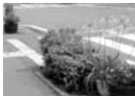
△ふれあい花壇づくり事業による緑化

◆市内の大気汚染物質はほとんど環境基準を達成していて、大気は良好な状態です。この良好な状態を維持、また向上させるために市民のみなさんと事業者のみなさんの協力をお願いします！