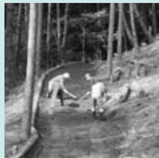
▲地域活性化事業補助金による今井区オラータの森・マレットゴルフ場整備

見直しの趣旨や進め方について、補助金等を受けている団体をはじめ市民のみなさんへの説明会を開催しますので、市の財政事情や行財政改革の取り組みを聞きご意見をお寄せください。